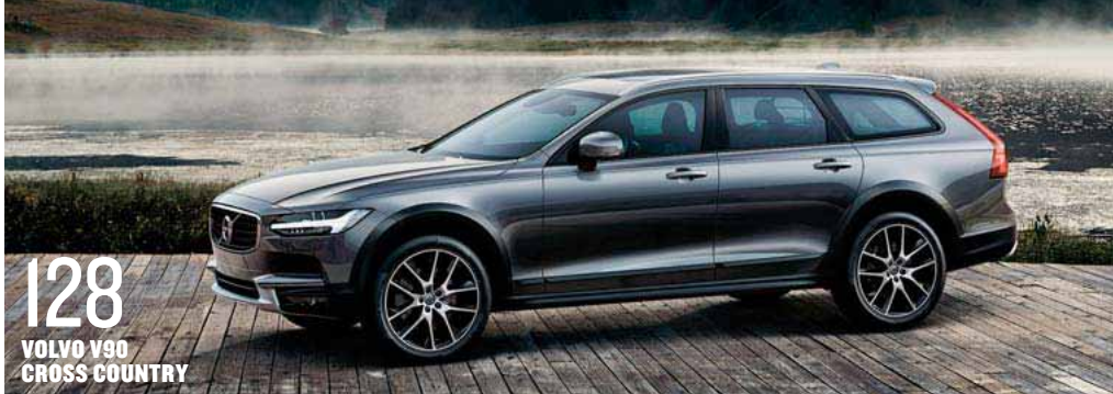
128 VOLVO V90 CROSS COUNTRY

R ząd zamierza wprowadzić duże, wręcz rewolucyjne zmiany w podatku akcyzowym od samochodów. Wszystko wskazuje na to, że zaczną one obowiązywać w 2017 roku. W planach jest m.in. zmniejszenie wysokości akcyzy na auta z silnikiem o pojemności powyżej 2 litrów z ponad 18 proc. do około 4 proc. To dobra wiadomość dla tych, którzy lubią mieć pod maską motor słusznej wielkości i mocy. Wśród ponad 300 modeli prezentowanych w naszym katalogu „Nowości 2017” mamy naprawdę duży wybór takich, które spełniają te oczekiwania. Czy te zasady podatkowe wpłyną na wzrost sprzedaży nowych samochodów w Polsce? Patrząc na siłę nabywczą naszych zarobków, raczej nie należy się spodziewać, że kupujący przerzucą się z komisów z autami używanymi i nagle zaczną oblegać salony samochodowe. Wprawdzie mijający rok 2016 dla producentów i importerów był bardzo udany, ale nadal nowe pojazdy to zaledwie 20-25 proc. ogółu rejestracji. Być może proporcje te zmienią się o kilka proc. na korzyść aut z salonów, gdyż klienci mają do wyboru coraz więcej atrakcyjnych form finansowania. Mamy także nadzieję, że nasz katalog zachęci do zakupu nowego samochodu i pomoże Wam wybrać ten, który spełni Wasze marzenia. Zapraszamy do lektury i życzymy udanych zakupów!