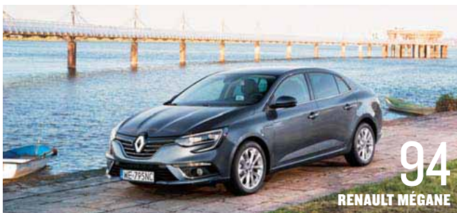
94 RENAULT MÉGANE