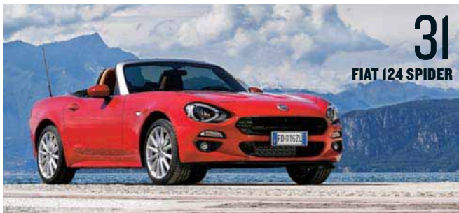
31 FIAT 124 SPIDER