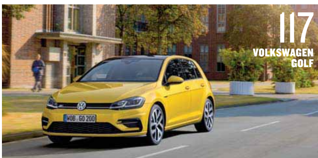
117 VOLKSWAGEN GOLF