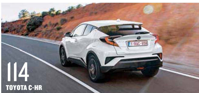
114 TOYOTA C-HR